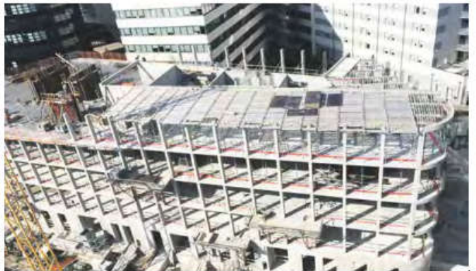
En 15 ans, la STCE est passée de 40 à 170 salariés

Entre autres projets en cours, celui de l'écocité des Jardins des Maraîchers, au sud-est de Dijon. Sur le site des anciens abattoirs et d'anciens terrains maraîchers, la Société de travaux du centre construit actuellement des logements collectifs pour trois maîtres d'ouvrage différents.