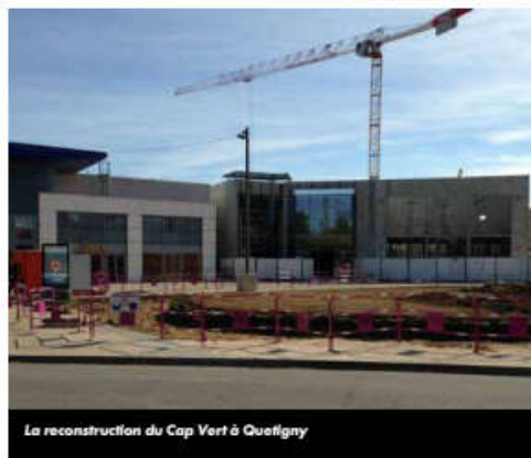
La reconstruction du Cap Vert à Quétigny

« Au départ, nous cherchions à acheter une entreprise proche de la nôtre dans une