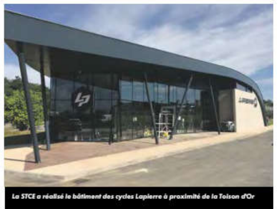
La STCE a réalisé le bâtiment des cycles Lapierre à proximité de la Tolson d'Or