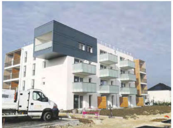
La majeure partie du volume d'affaires de la STCE est réalisé sur des immeubles de logements collectifs et des bureaux à usages publics